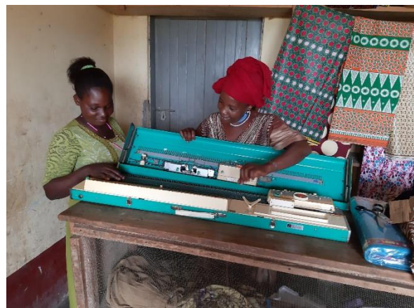
Nieuwe breimachine voor Immaculate

Stichting Masomo Rogier van Leefdaelstraat 17, 5081 JK Hilvarenbeek Telefoon: 06 8370 7427 email: info@masomo.eu website: www.masomo.eu IBAN: NL51RABO 0130 8209 03 ANBI/Fiscaalnummer: 8175.69.492